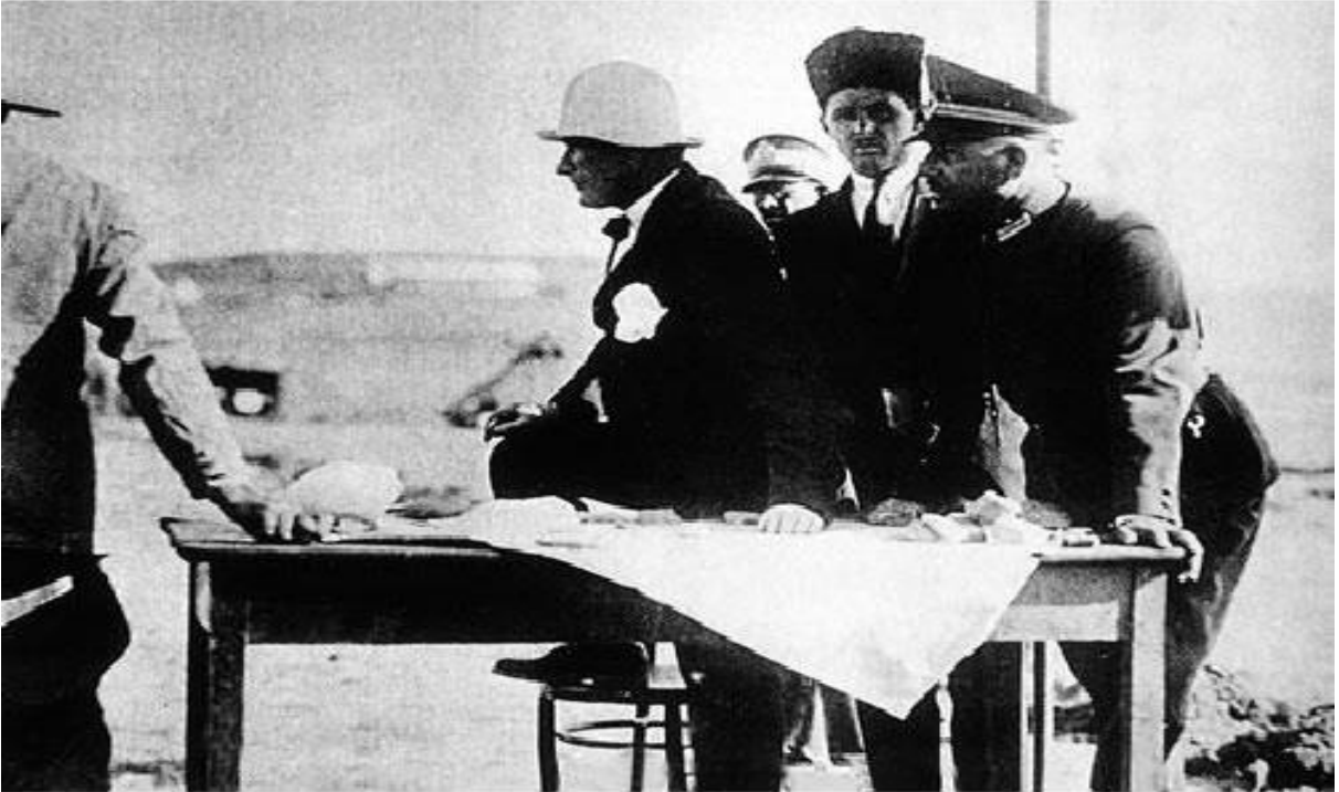
Atatürk - Orman Çiftliği (1925)