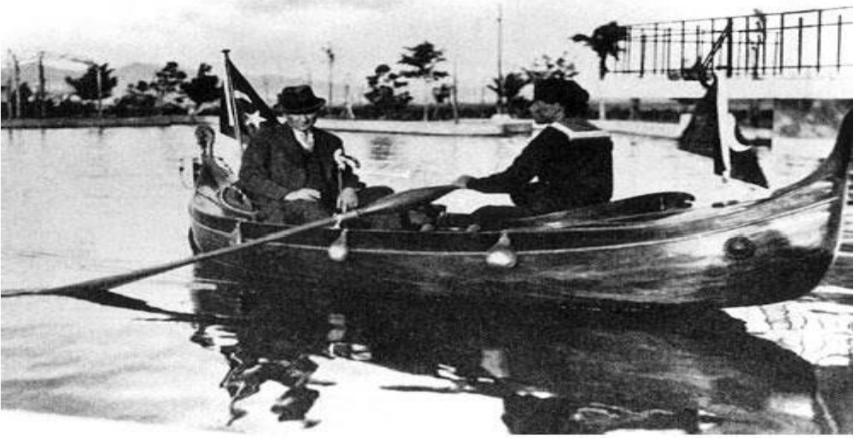
Orman Çiftliği (1929)